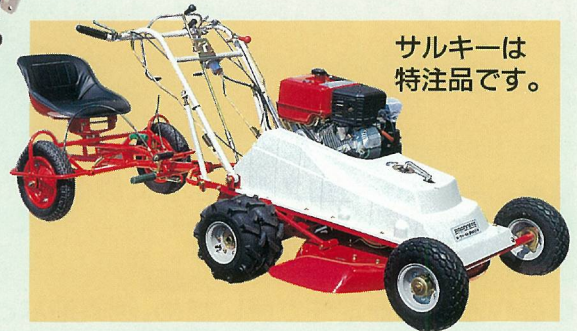
サルキーは特注品です。