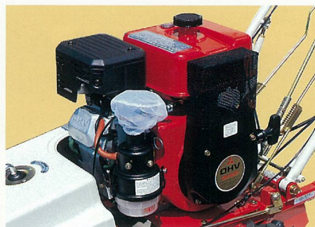
始動性、耐久性にすぐれたエンジンで、連続負荷運転や酷暑下でも高性能を発揮します。